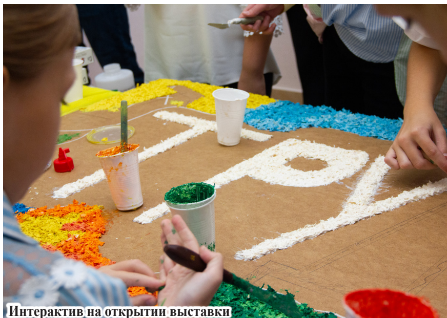
Интерактив на открытии выставки