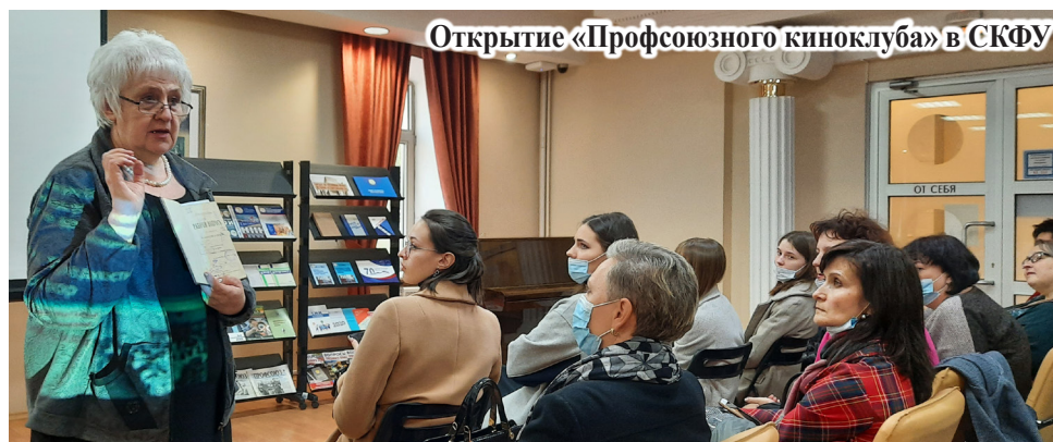
Открытие «Профсоюзного киноклуба» в СКФУ

«Публицистическая и художественная рецепция истории профсоюзного движения» – так называется выставка книг, подготовленная сотрудни-