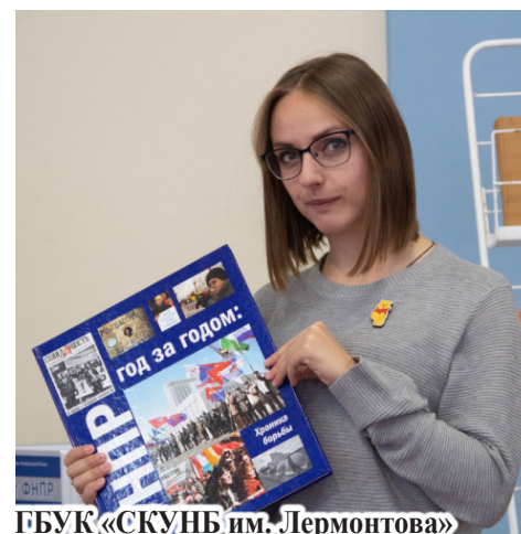
ГБУК «СКУНБ им. Лермонтова»

Федерация профсоюзов Ставропольского края совместно с научной библиотекой Северо-Кавказского фе-