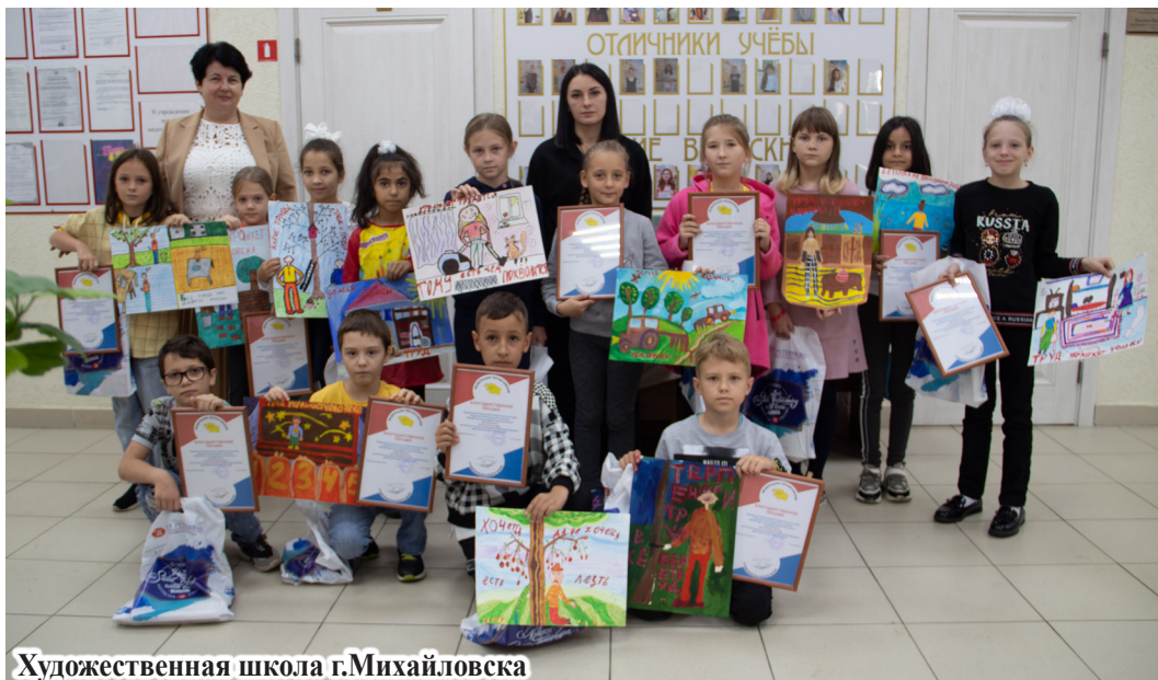
Художественная школа г. Михайловска