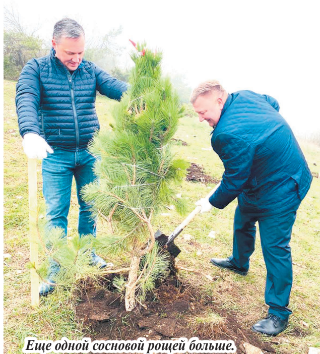
Еще одной сосновой рощей больше.

С 24 по 30 мая пройдут праймериз «Единой России». Нашим депутатам требуется поддержка. Вместе с ними мы сможем эффективнее защищать интересы трудящихся. Сегодня мы нуждаемся в такой команде – работоспособной и нацеленной на результат.